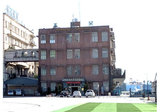
「基隆關」大樓外觀照片